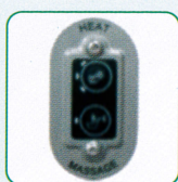
Calor y masaje